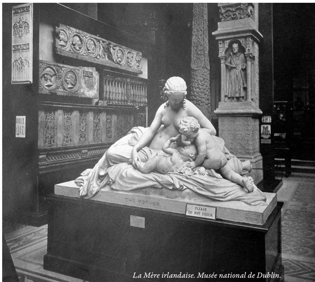
La Mère irlandaise. Musée national de Dublin.

L'Histoire illustrée de l'Irlande d'A. M. Sullivan, ces aiguilles enfoncées dans ma peau depuis bientôt trente-cinq ans, tant de lectures, tant de relectures par toutes sortes de saisons, en toutes sortes de circonstances, pour le simple plaisir de virailier, d'engranger de la connaissance et de m'y perdre autrement que mangé par les banalités de la vie quotidienne. La carte du pays à redessiner autrement qu'en noir. Des politiciens à élire autrement qu'en caricature démocratique. Ce semblant de nation, nébuleuse spiraloïde, défaisant même le bien bâti puisque si schizophrènes et hystériques nos corps privés d'esprit. Nous faisons de nous tous des exilés intérieurs, nous pourrissions par