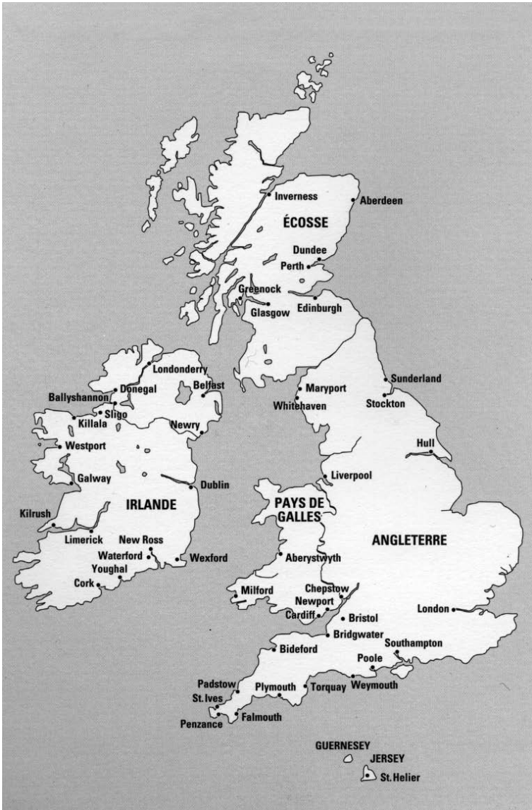
L'Irlande et les îles britanniques